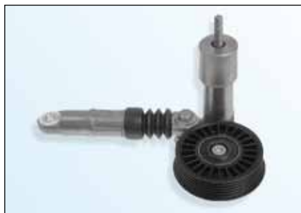
Slika 1: 534 0014 10

S obzirom na nedostatak prostora, u ugrađenom stanju stručno rastavljanje natezača remena nije moguće.