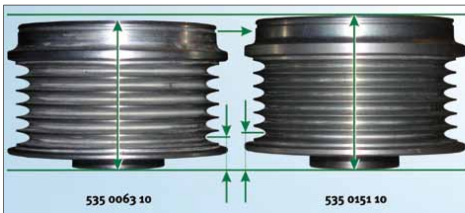
Slika 3: Razlikovanje remenica za slobodni hod alternatora INA 535 0063 10 (VALEO) i 535 0151 10 (DENSO)