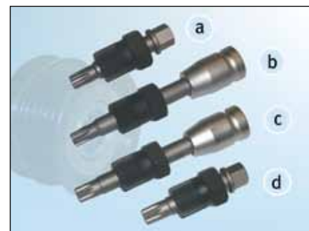
Slika 2: Pregled specijalnih alata