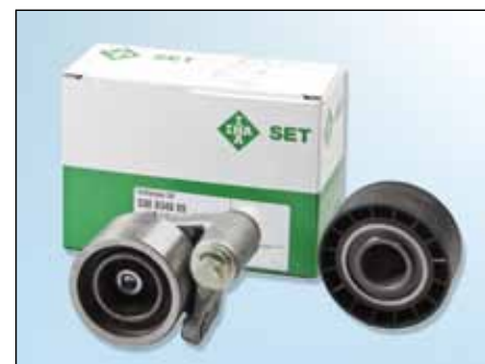
Slika 3: SET 530 0348 09

Osim pojedinačnih kolotura za napinjanje 531 0377 10 kožete od dobavljača Schaeffler Automotive Aftermarket naručiti i odgovarajući SET ili KIT koji sadrži sve potrebne komponente za zamjenu remena razvodnog mehanizma.