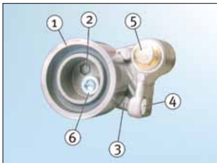
Slika 2: Kolotur za napinjanje remena 531 0377 10