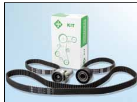
Slika 4: KIT 530 0348 10

Odgovarajuće rezervne dijelove ćete naći u našem on-line katalogu na adresi www.Schaeffler-Aftermarket.com ili u RepXpert na adresi www.RepXpert.com .