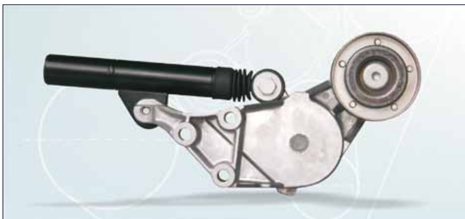
Slika 1: Jedinica natezača 533 0081 30 – u upotrebi kod 1.9 TDI motora

*) SH -> napinjač remena GFL -> remenica slobodnog hoda alternatora