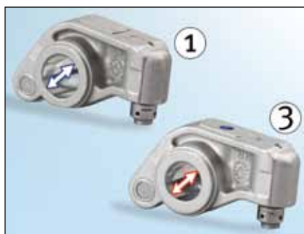
Slika 2: Poluga ventila usisa (1) je većeg presjeka

Prilikom montaže neophodno je osigurati ispravan raspored dijelova. Razlike mogu biti utvrđene prema raznim promjerima otvora za vratilo poluge ventila ( slika 2 ) kao i prema drugačijem obliku poluge ventila ( slika 3 ).