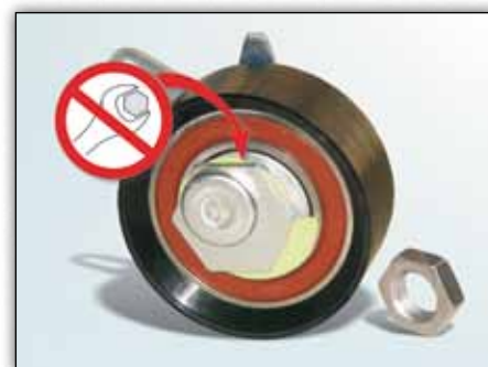
Slika 2: Šesterokut koji se nalazi na stražnjoj strani natezne rollice nema nikakvu funkciju

Natezač 531 0573 30 montira se sa stražnje strane na držač. Šesterokut na stražnjoj strani nije majenjen niti za ugradnju niti za podešavanje natezne rollice.