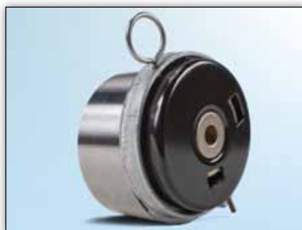
Slika 3: Pogled straga prethodnog modela