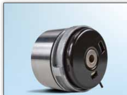
Slika 4: Pogled straga novog modela

Zbog neprekidnog razvoja kvalitete naših proizvoda, promjenjena je izvedba natezne rolice Kat. Br. 531 0779 10. Servisna informacija pokazuje vizualne razlike između dvije izvedbe (vidi slike od 1 do 4).