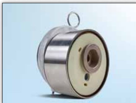
Slika 1: Pogled sprijeda prethodnog modela