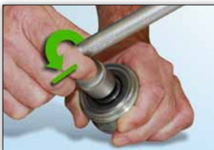
Slika 4: Alat se odmah blokira i ne može biti pokrenut u smjeru obrnutom od kazaljke na satu.