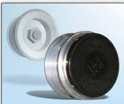
Slika 2: Zaštitni poklopac mora biti ugrađen na OAP i OAD da bi se spriječio ulaz nečistoća.

Vrlo je teško procijeniti ispravnost rada remenice slobodnog hoda alternatora, kada je ista već ugrađena. Stoga je preporučljivo da se remenica slobodnog hoda alternatora skinje prije ove provjere.