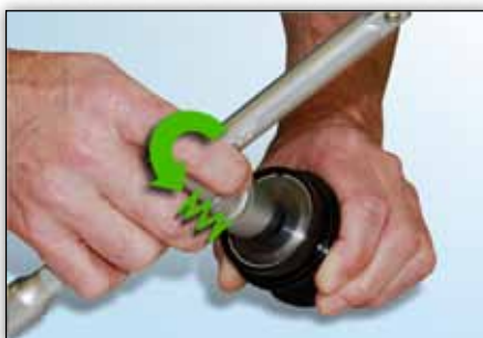
Slika 6: Osjetiti ćete jaki otpor opruge kada se alat okreće obrnuto od smjera kazaljke na satu.