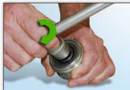
Slika 5: Alat se može neprestano vrtiti u smjeru kazaljke na satu sa laganim otporom.