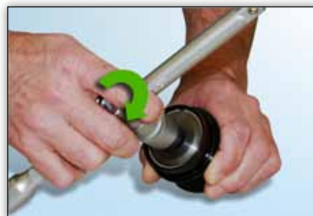
Slika 7: Alat se može nesmetano vrtiti u smjeru kazaljke na satu sa laganim otporom.