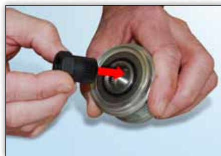
Slika 3: Odgovarajući adapter je umetnut u remenicu slobodnog hoda

Odgovarajući adapter mora biti odabran iz kita alata prilikom skidanja i provjere rada OAP ili OAD.