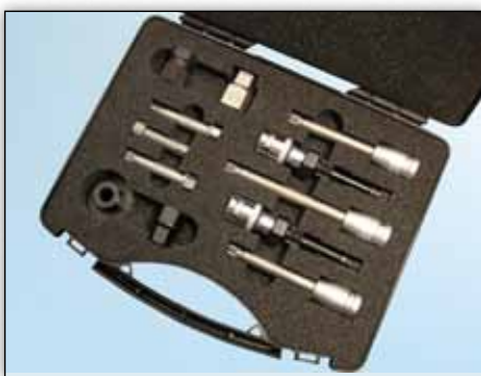
Slika 3: INA-poseban montažni alat, broj dijela 400 0241 10

Obje remenice za prazni hod alternatora bez ikakvih rezervi udovoljavaju tehničkim zahtjevima i razlikuju se samo po izgledu.