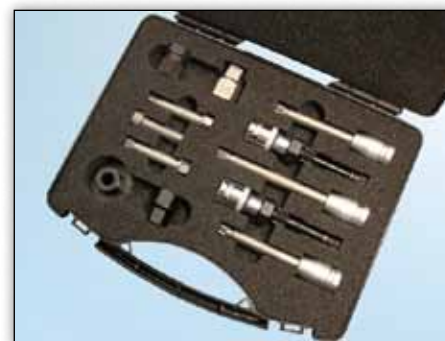
Slika 3: INA-specijalan alat za ugradnju, br. za narudžbu 400 0241 10

Za ugradnju i skidanje remenica slobodnog hoda alternatora potreban je poseban alat za ugradnju ( slika 3 ).