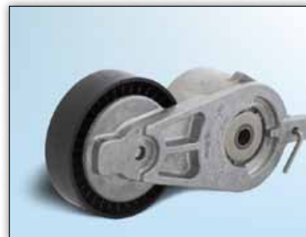
Slika 2: Verzija br. 2

U navedenim vozilima se tvornički ugrađuju dvije različite izvedbe jedinice natezača agregatnog pogona.