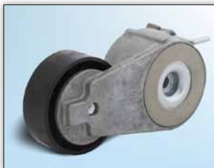
Slika 1: Verzija br. 1