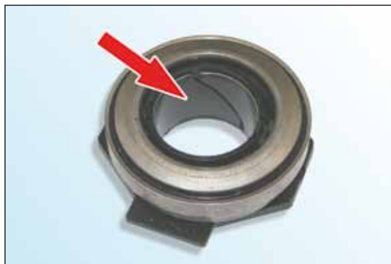
Slika 1: 500 0671 11

Mazivo između čahure od Permaglida i obujmice za vođenje povećava njihovo trošenje!