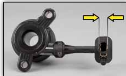
Slika 2: LuK CSC 510 0097 10 hidraulični priključak Ø 12,2 mm/Ø 13,3 mm, Ø 11,7 mm/Ø 12,2 mm