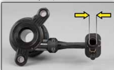
Slika 3: LuK CSC 510 0098 10 hidraulični priključak Ø 12,2 mm/Ø 13,3 mm, Ø 11,7 mm/Ø 12,2 mm