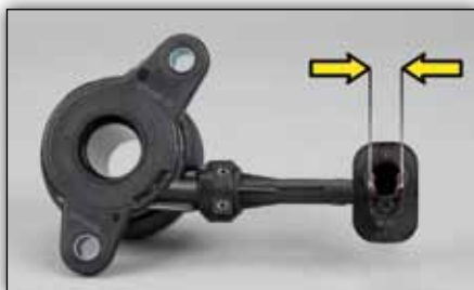
Slika 1: LuK CSC 510 0090 10 hidraulični priključak Ø 12,2 mm/Ø 13,3 mm, Ø 11,7 mm/Ø 12,2 mm

510 0090 10 510 0097 10 510 0098 10 510 0137 10