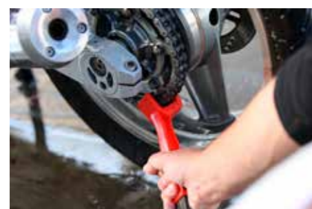
Uz posebna sredstva, lanac je lako držati u top formi

U Tokić poslovnica potražite široku paletu usko specijaliziranih proizvoda za čišćenje i njegu motocikla i moto opreme